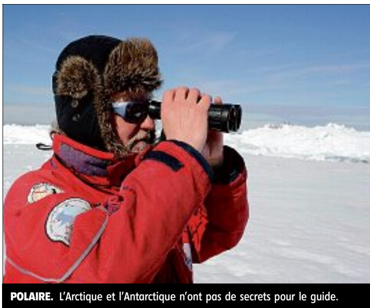
POLAIRE. L'Arctique et l'Antarctique n'ont pas de secrets pour le guide.