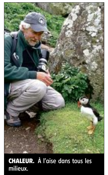
CHALEUR. À l'aise dans tous les milieux.

➔ Pratique. Le prix du livre est de 25 €. On devrait pouvoir le trouver prochainement à la librairie de Pithiviers, place du Martroi. On peut également le commander sur internet.